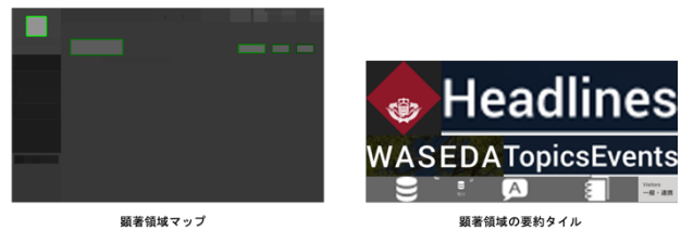
図 2. 出力結果例 (早稲田大学 HP)

例として早稲田大学 HP [4] を入力した時の 2 つの重要領域の出力結果を以下の図 2 に示す。